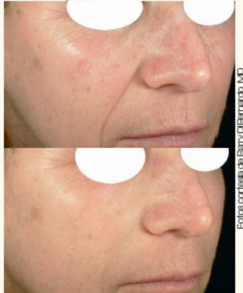
Paciente tratada con la fototerapia Genesis, el láser Genesis y Titan